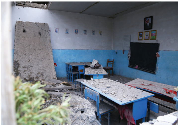
Escuela secundaria Sarijali de la región Aghdam, (para 220 alumnos) destruida por el ataque de artillería