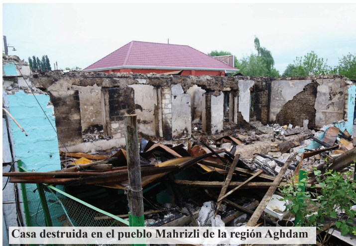
Casa destruida en el pueblo Mahrizli de la región Aghdam