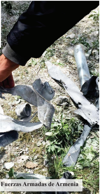
El proyectil lanzado por las Fuerzas Armadas de Armenia