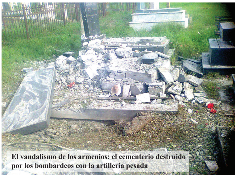
El vandalismo de los armenios: el cementerio destruido por los bombardeos con la artillería pesada