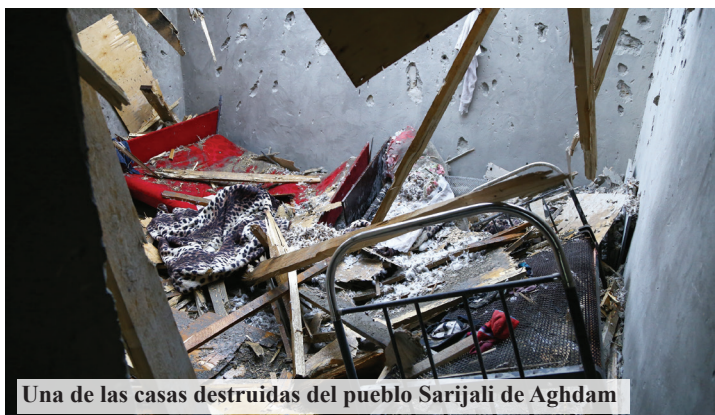
Una de las casas destruidas del pueblo Sarijali de Aghdam